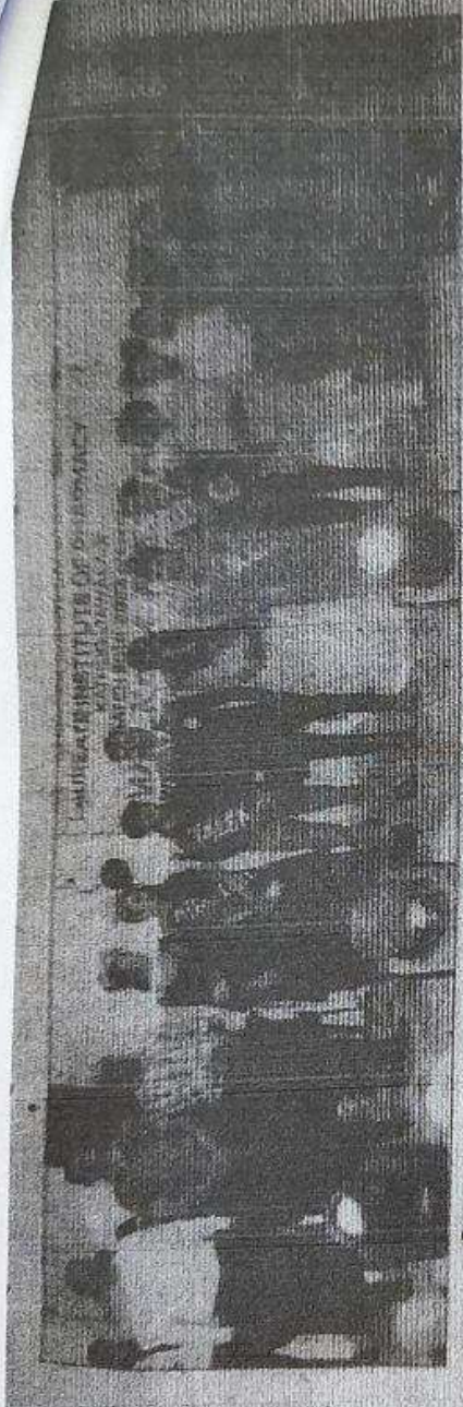
ज्वालामुखी : कार्यक्रम में उपस्थित गण्यमान्य व प्रतिभागी।